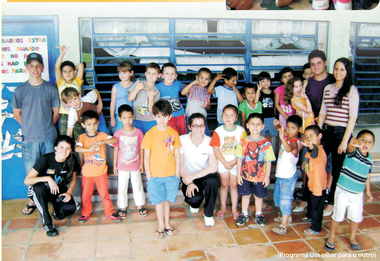
(Programa Um olhar para o outro)