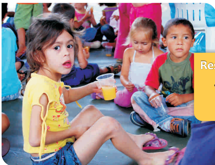
(Programa Padrinho Legal)

...da IENH com a Fundação Semear e o programa Padrinho Legal, favorecendo 15 crianças e jovens das seguintes entidades: Associação de Assistência ao Menor em Oncologia – AMO, Associação Beneficente SOS Pequena Criança, Associação Beneficente Nossa Senhora Auxiliadora, Centro Medianeira, Associação Vida Nova, APAE - NH. A contribuição mensal de 68 colaboradores/as da IENH reverte em benefício da manutenção das crianças e jovens nas organizações sociais.