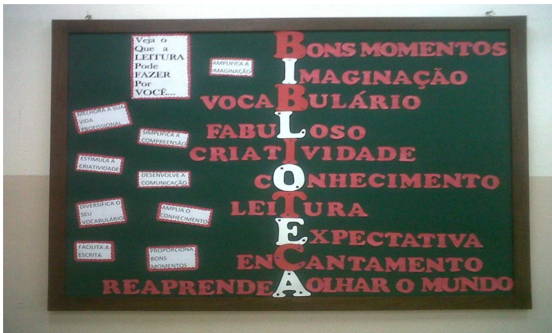
Figura 1 – Mural Biblioteca IENH

Tamanho 10 e espaçamento simples Se fosse de um livro, a fonte seria: (SOBRENOME DO AUTOR, ano, p.)